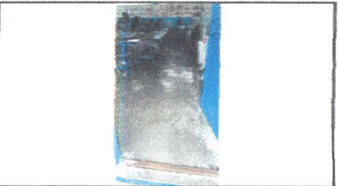
Foto 3: Sustitución de piso de cemento líquido por piso de granito